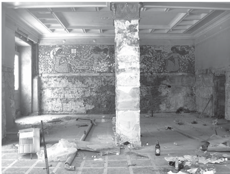
Рис. 5. Кафе Лагидзе в 2009 г.

И они их стерли, уж будьте уверены. Кафе Лагидзе на улице Руставели — пустое, призрачное напоминание о социализме — в конце концов пало под напором участников революции роз, которые настойчиво утверждают, что при социализме не могло быть создано ничего стоящего. Оно было приватизировано в качестве торгового помещения в 2008 г. Кафе, которое когда-то служило предвестником модерности при царе и даже в эпоху социализма, превратилось в навязчивое напоминание этого ушедшего в прошлое будущего.