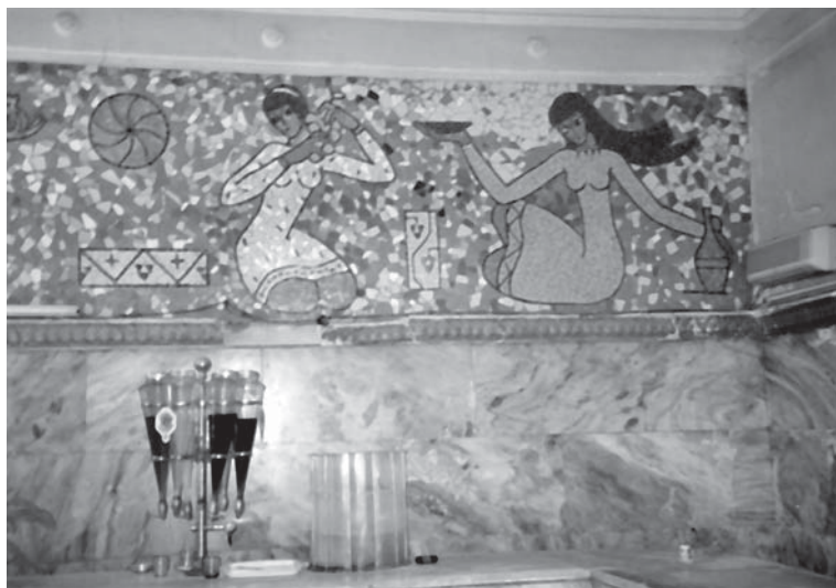
Рис. 4. Внутри кафе Лагидзе в Тбилиси. 2002 г.

Для меня, иностранца, кафе Лагидзе были убежищем, где я мог укрыться от жестоких законов гостеприимства супра . Одной из проблем во время моих полевых исследований было найти место, где я мог бы просто встретиться с другом и не подчи-