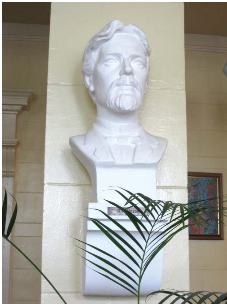
Ил. 13. Бюст А.П. Чехова в холле Областной библиотеки им. В.Г. Белинского, 1980-е гг.

общества, с которым встретился писатель. Но он даже не пытался познакомить Чехова с «культурным обществом». Более того, он не пригласил писателя на обед. Неприветливость родственника, плохая погода и непрезентабельность незнакомого уклада жизни произвели на Чехова неблагоприятное впечатление. Письма Чехова из Екб передают всю гамму его настроений: «Приехал в Екатеринбург — тут дождь, снег и крупа. Натягиваю кожаное пальто. Извозчики — это нечто невообразимое по своей убогости. Грязные, мокрые, без рессор; <...> у лошади копыта громадные, спина тощая... Здешние дрожки — это аляповатая пародия на наши брички. К бричке приделан оборванный верх, вот и все. И чем правильнее я нарисовал бы здешнего извозчика с его