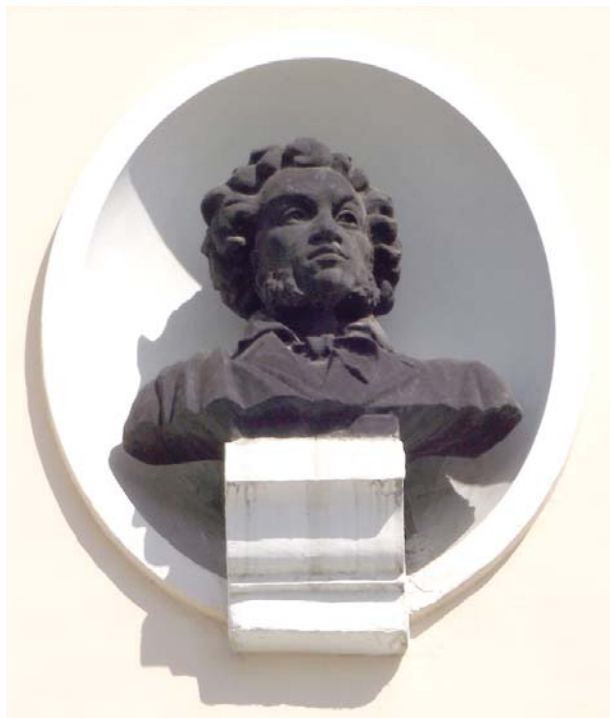
Ил. 7. Бюст А.С. Пушкина.

Мария Литовская. Приобщение и наказание: памятник литератору в провинциальном городе