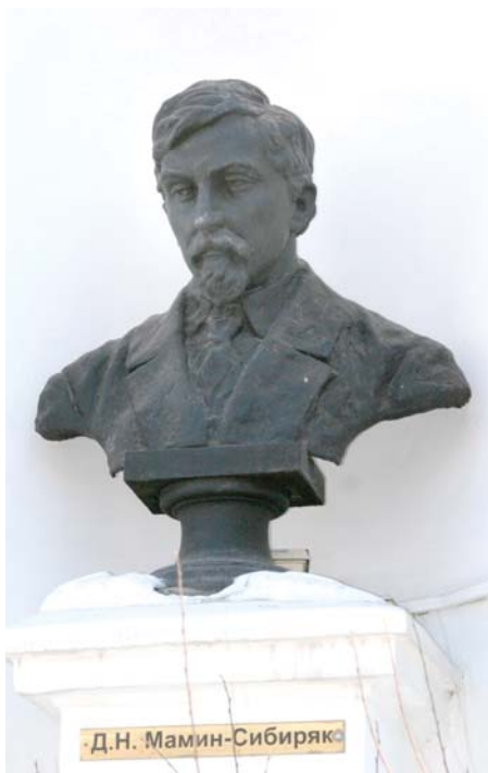
Ил. 4. Бюст Д.Н. Мамина-Сибиряка.