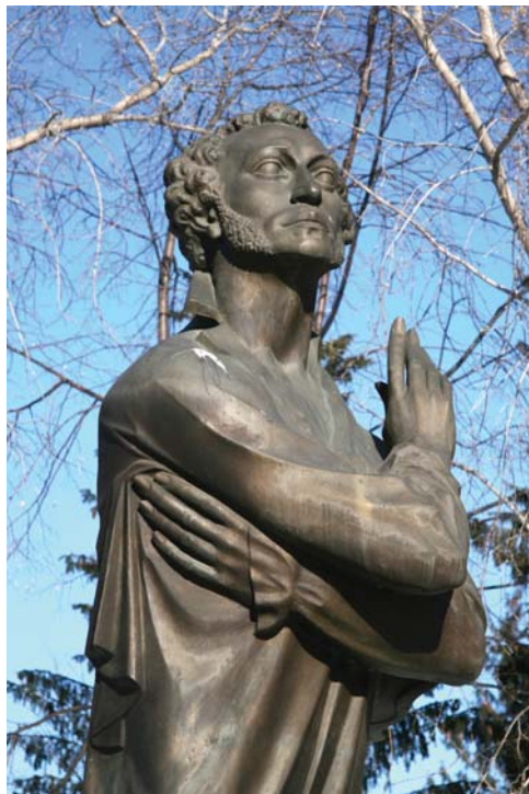
Ил. 9, 10. Памятник А.С. Пушкину в Литературном квартале

на то, что город Екатеринбург является не только промышленным, но и культурным центром. Поставленный на площадке между огромным «оборонным» заводом и кварталами старого города, он являет собой маркер территории культуры — музейной зоны. Хотя музей и посвящен писателям Урала, признанные главными из них — гении места Мамин-Сибиряк и Бажов — уже заняли свои места в самом престижном городском пространстве. Пушкин, таким образом, метонимически обозначает русскую литературу вообще 1 .