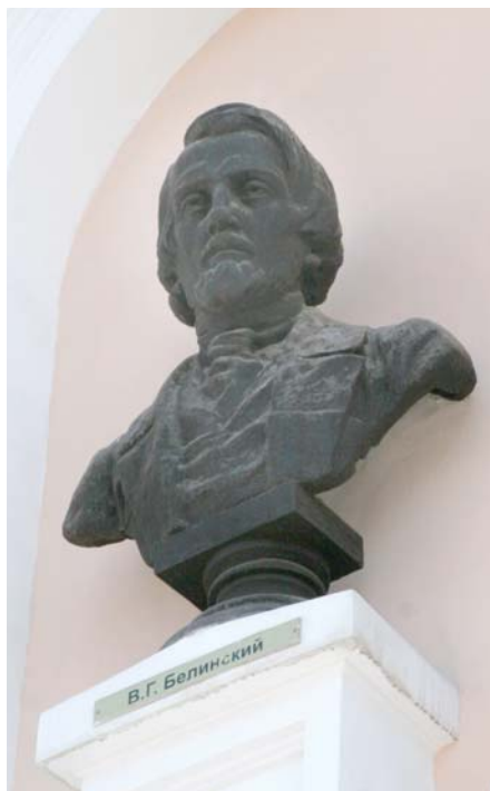
Ил. 3. Бюст В.Г. Белинского.