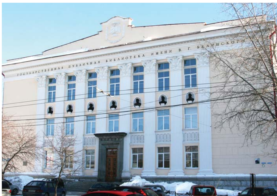
Ил. 8. Общий вид фасада старого здания Областной библиотеки им. В.Г. Белинского.