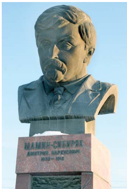
Ил. 1. Бюст Д.Н. Мамина-Сибиряка.