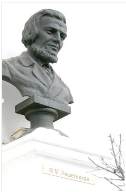
Ил. 5. Бюст Ф.М. Решетникова.