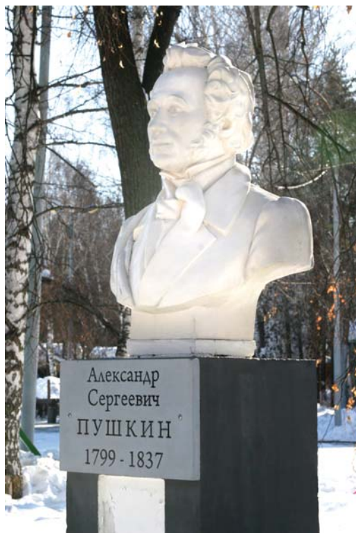
Ил. 12. Бюст А.С. Пушкина в Аллее литераторов.