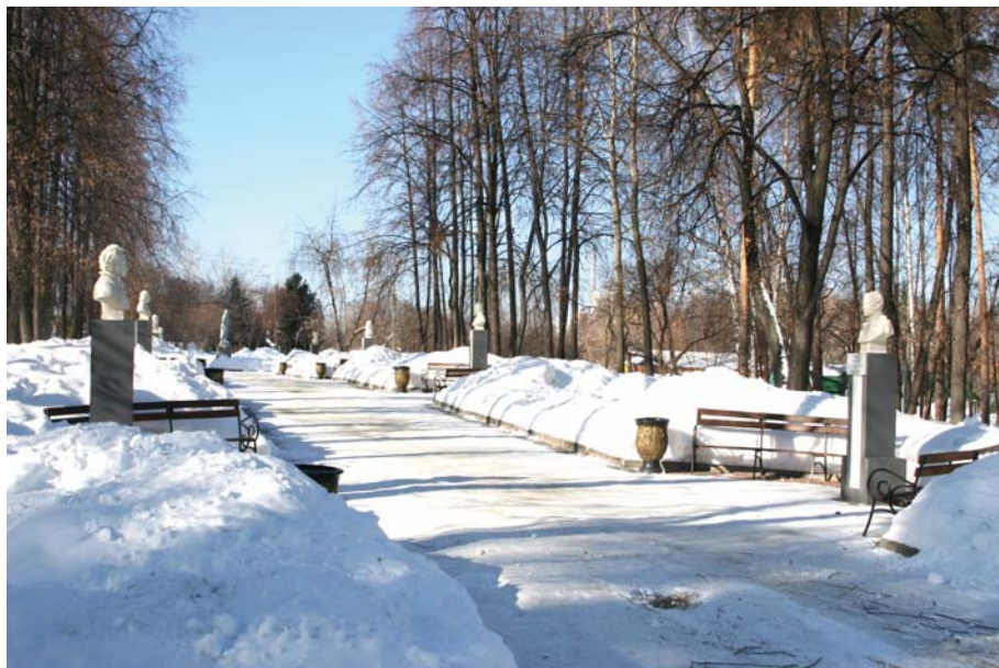
Ил. 11. Аллея литераторов в ЦПКиО им. В.В. Маяковского.