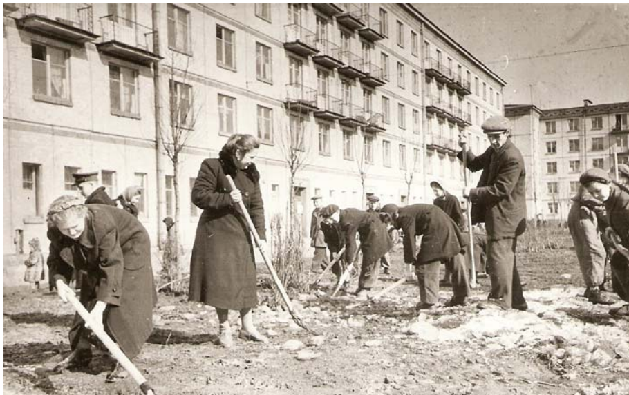
На воскреснике. Фотохроника ЛенТАСС, 5 апреля 1959 г. ЦГАКФФД № Ар 167299

Вместо того чтобы выполнить предписание, члены комиссии, будучи сами жителями дома, решили сохранить существующие сараи или хотя бы отсрочить их снос, т.к. новые показались им очень малы для хранения таких вещей, как «детские санки, лыжи, велосипеды, коляски, а так-же бочонки с капустой и др. непредусмотренные бытовые вещи». Комиссия недоумевала: «Для чего освобождаемая из-под сараев площадь Р.И.К. если сами проживающие в домоуправлении съёмщики не поднимают такого вопроса?!» — и главным аргументом в предстоящих переговорах с райисполкомом считала возможность сохранить старые сараи «без ущемления сада и игры детям» [ЦГА. Ф. 4948. Оп. 4. Д. 310. Л. 11–12об].