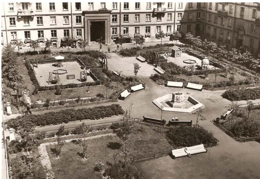
Общий вид детской площадки в одном из кварталов Московского района Ленинграда. 1950-е гг. Архив ЦГА КФФД. Бр 35763

условно, общим пространством. На фоне активной дворовой жизни предшествующих лет лишенные сараев, поленниц, голубятен и т.п. новые благоустроенные дворы выглядят удивительно безлюдными.