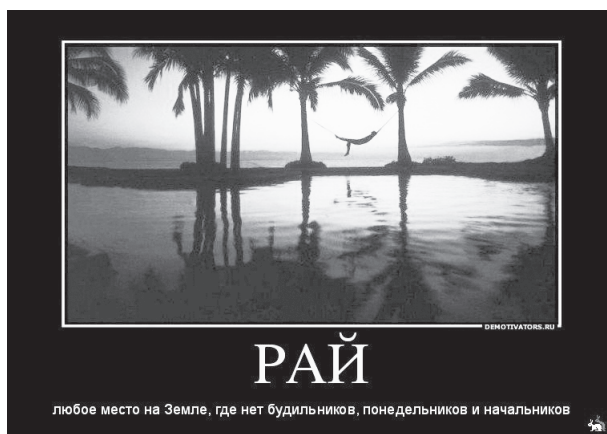
Рис. 5. См. цветной вариант на вклейке — ил. 1